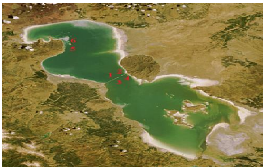
شکل ۱- عکس ماهواره‌ای و محل‌های نمونه‌برداری از

نمونه‌برداری از آب و نمک دریاچه ارومیه از شش ناحیه مختلف آن در بهار و تابستان سال ۱۳۹۲ انجام گرفت (شکل ۱). به دلیل بحران خشک‌سالی دریاچه ارومیه این کار تنها از دو طرف پل میان‌گذر دریاچه ارومیه و ناحیه شمال دریاچه ارومیه (ایستگاه باری) که پس‌روی آب دریاچه ارومیه کمتر هست امکان‌پذیر شد. شوری آب دریاچه در فصل بهار و تابستان ۱۳۹۲ در تمامی محل‌های نمونه‌برداری بیش از ۳۴۰ گرم در لیتر بود.